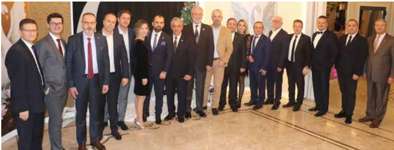
Bulgaristan Bursa Konsolosu Veselin BOJİLOV ve eşi Ami BOJİLOVA