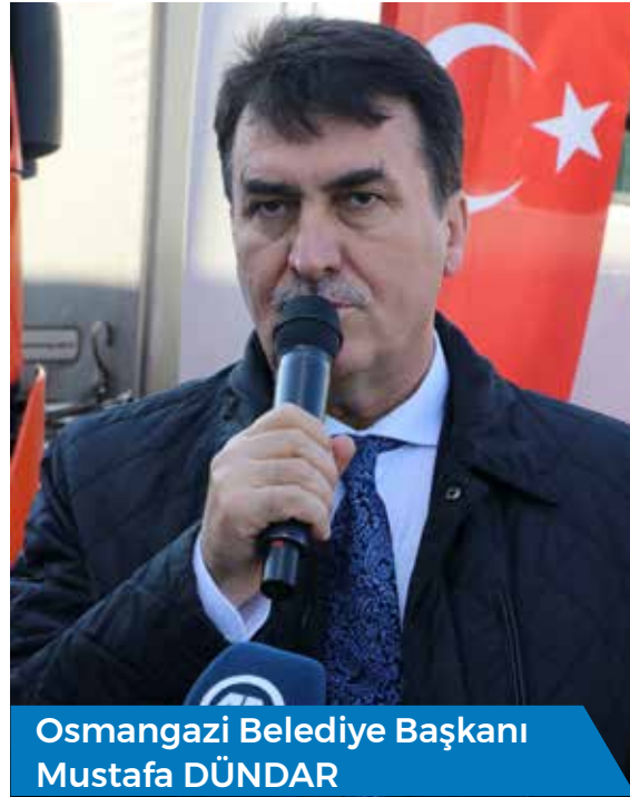
Osmangazi Belediye Başkanı Mustafa DÜNDAR